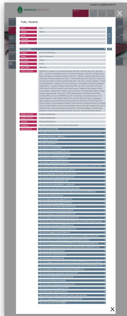
Abb. 3 – Details

Neu kann im CRM+KYC über den [REFINITIV WORLD CHECK] Button oben rechts die im CRM erfasste Person geprüft werden. Diese Prüfungen ist nur möglich bei „Natürlichen Personen“.