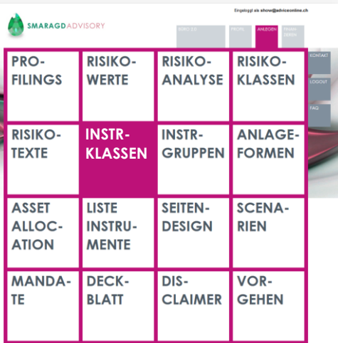
Bereich ANLEGEN mit allen Möglichkeiten zur Konfiguration.

Wir sind mit dieser Funktion einem Kundenwunsch nachgekommen und können somit sagen, dass unsere Kunden fortan punkto Strategie von A bis Z komplett alles selbst konfigurieren können. Innert Minuten.