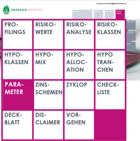
Bereich FINANZIEREN mit allen Möglichkeiten zur Konfiguration.

Durch diese Option können Sie steuern, ob die Tragbarkeit basierend auf der effektiven Hypothekarschuld berechnet wird, oder Zusatzsicherheiten zuerst in Abzug gebracht werden. Bei Aktivierung ist die Berechnung restriktiver.